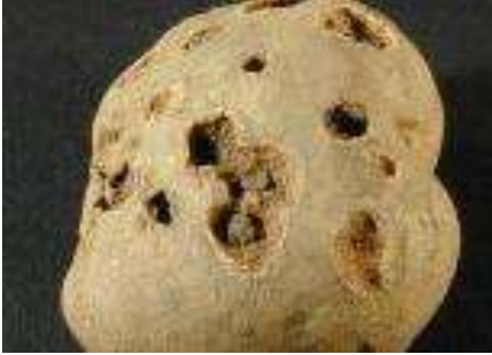
Çukur uyuz lekeleri