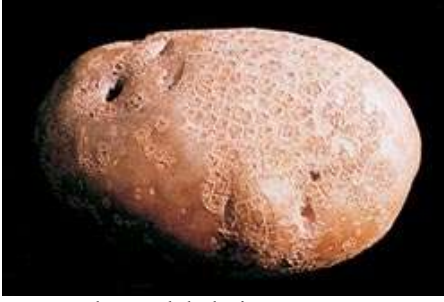
Yüzeysel uyuz lekeleri