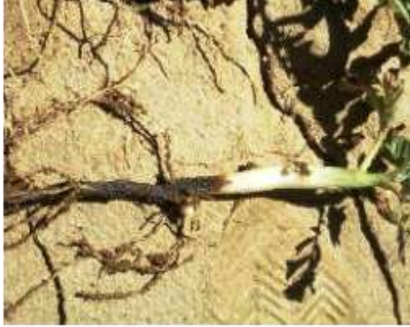
Karabacak veya dip yanıklığı belirtisi