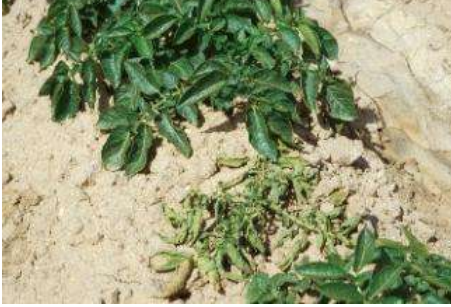
Gelişmede durgunluk, çalılışma ve bodurluk