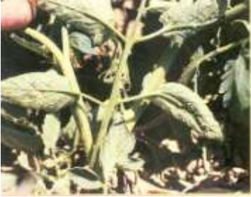
Domateste yaprakbiti zararı